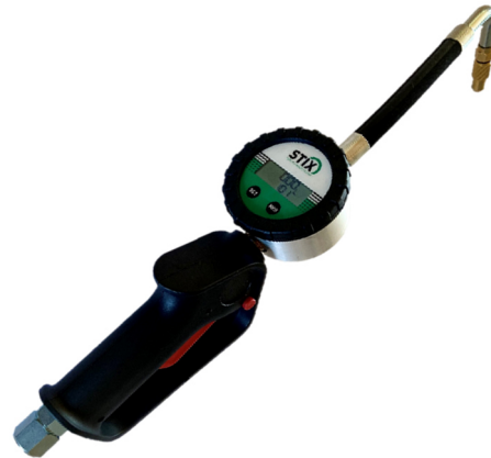
Einbauzähler / Impulsgeber